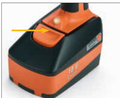
Inklusive zwei 5,0 Ah Li-Ionen Akkus Die LED dient als aktive Akku-Kapazitätsanzeige.