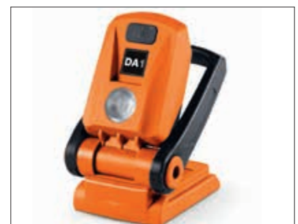
LED-Arbeitsleuchte optional Mit 900 Lux sehr hell, kompatibel mit allen DA1 Akkus.