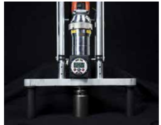
Montierter Torque Control TC1

Das Drehmoment ist direkt am Display des Sensors sichtbar. Zusätzlich kann ein Soll-Wert definiert werden. Bei Überschreitung der angegebenen Toleranz stößt das Gerät ein akustisches Warnsignal aus. Über eine Anzeige mit LED-Ampelfarben wird der Bediener zusätzlich auch visuell über das Drehmomentergebnis informiert. Dieses Feature ist besonders nützlich, wenn in einer lauten Umgebung gearbeitet wird.