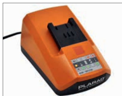
Inklusive Schnell-Ladegerät (230 V, 50/60 Hz oder US-Version 110 V, 50/60 Hz)